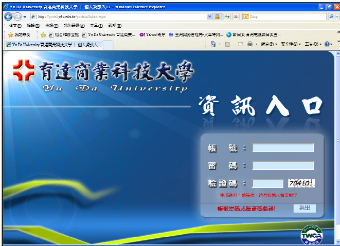
步驟一：進入資訊入口，登入帳號密碼