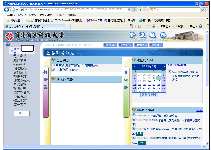
步驟二：點選電子表單