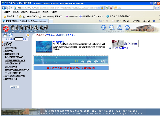
步驟三：點選學生宿舍外宿請假申請