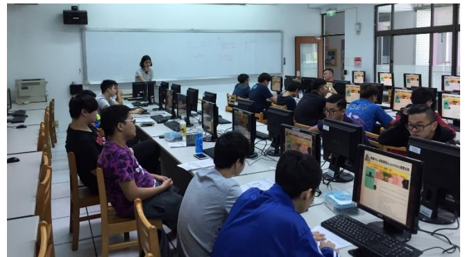
106/09/21 學習歷程入班宣導