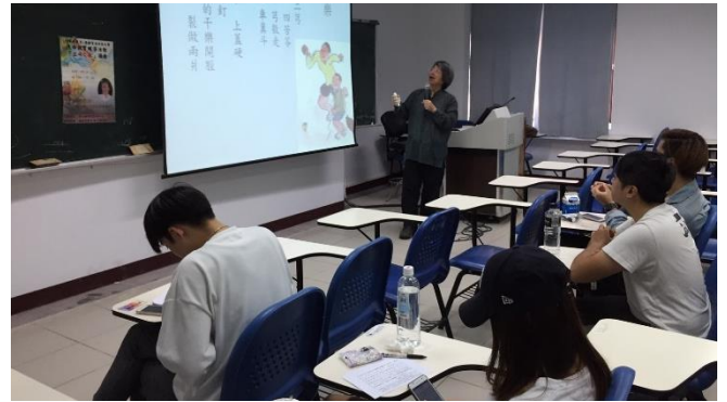
106/09/27 特色主題計畫-生命之歌活動