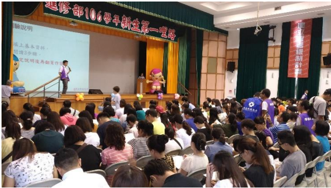
106/09/12 新生適應量表測驗